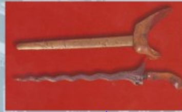
Кинжал, XIX (девятнадцатый) век