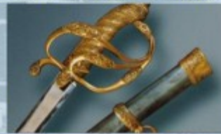
Сабля, XIX (девятнадцатый) век

-Прочитайте и запишите, какое стрелковое оружие есть в Музее? (Читают слайд №8)