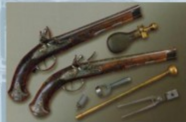
Пистолеты, XVIII (восемнадцатый) век

-Давайте познакомимся, с миниатюрными работами, представленными в музее (слайд №; 9)