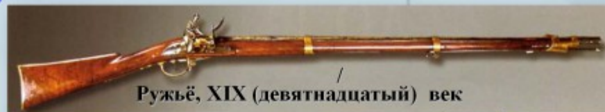
Ружьё, XIX (девятнадцатый) век

-Прочитайте и запишите, какое стрелковое оружие есть в Музее? (Читают слайд №8)