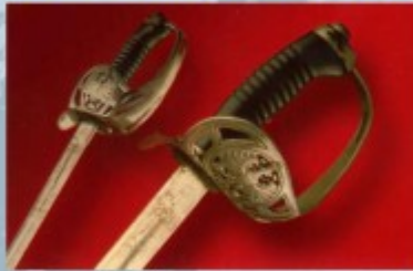
Палаш, XIX (девятнадцатый) век

В разнообразной музейной коллекции холодного оружия представлено большинство образцов, состоявших на вооружении российской армии, а также западноевропейские шпаги, палаши, сабли.